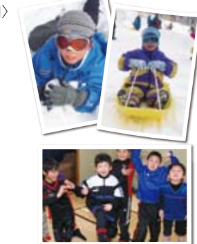
キャンプスケジュール