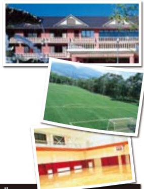
キャンプスケジュール